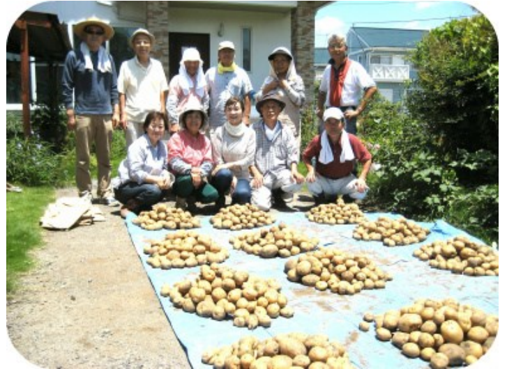
大収穫の落合農園㊤

他の班から「3班は良く集まっているね」と言われますが、今年度もほぼ昨年同様の活動でした。定例の花ボラの後の喫茶、食事や4年目の落合農園の農作業？が中心でしたが、今年も昨年にも増しての猛暑で、班員の中には寄る年波の方もいて、そろそろ農園の継続も危ぶまれて来ました。それに代わって行動半径の広い女性陣のリードで、暑気払いには太田市のレストランまで遠征、忘年会では熊谷駅前の居酒屋で海鮮料理。初めての班員にも好評でした。今後も〈食い気〉の方面を主体に、プランが進む予感がします。その他、36期の年間の諸行事には積極的に参加した一年でした。