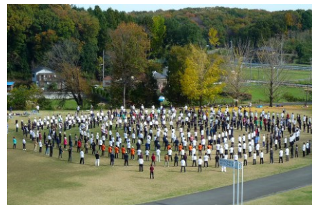
揚名時太極拳演武研修会に参加

クラブ発足後、6年目を迎えようとしています。今では簡化24式 (11.21 武蔵丘陵森林公園) 一連の基本姿勢をほぼ全員がマスターし、太極拳3つの極意〈心・息・動〉(注1)を極められるよう舞っています。鍛錬を積み重ねるほどに、その奥の深さを心身でひしと受け止め、稽古に励んでいます。現在は円形になる新しいスタイル(百花拳)の練習を始めました。注1 26年度会報(前期号:P9)参照