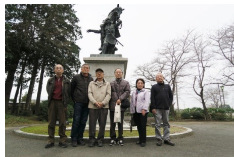
畠山重忠公史跡公園