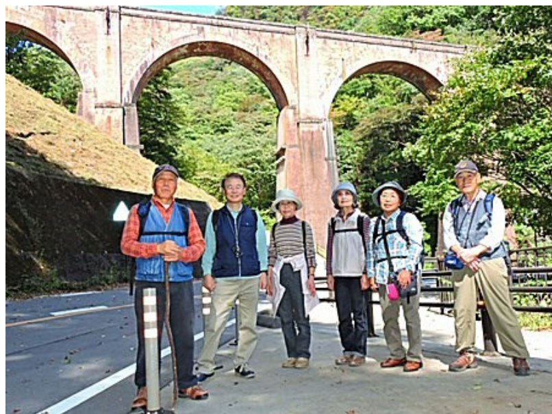
碓氷峠・めがね橋

10 月 8 日碓氷峠アプトの道、めがね橋、ハイキング、カラオケ招き猫にて忘年会等いろいろ班活動をして来ました。