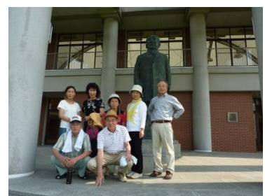
渋沢栄一記念館 (赤城山を望む栄一像)