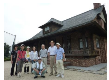
誠之堂・清風亭 (大正5年建造レンガ建築)