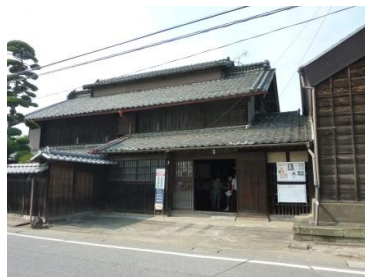
尾高惇忠生家 (この家の2階で高崎城乗っ取りの密議が……)